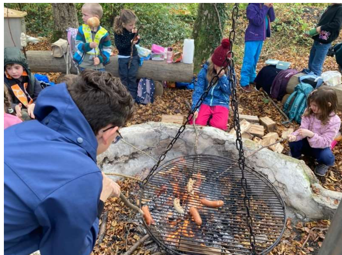
Die Schulkinder beim Grillen

Die Kinder spielten sehr lange zusammen und hatten viel Spass. Kurz nach 13 Uhr war es dann Zeit, nach Hause zu wandern. Also machten wir uns langsam auf den Heimweg. Kaum waren wir losgelaufen, fing es wie auf Knopfdruck an, recht stark an zu regnen. So liefen wir einen Zacken schneller. Zwischendurch hörte der Regen sogar einige Male auf. Bald darauf kamen wir an dem Ort an, wo viele Eltern ihre Kinder abholten. Der Rest ging mit den Lehren:innen in die Schule zurück, wo auch noch einige Eltern ihre Kinder in Empfang nahmen. Es war ein toller Tag, auch wenn wir am Schluss noch ein bisschen verregnet wurden.