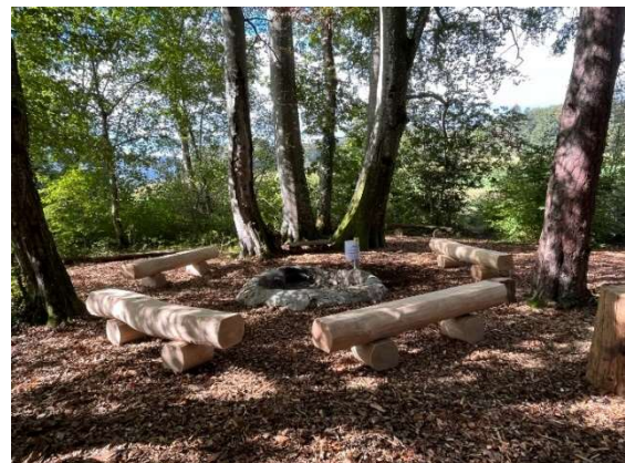
Team „Holzenberg & Brännli“